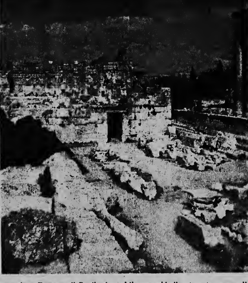
E tempelman Romano di Baalbeck na Libanon, aki riha, ta entre esnan di mas grandioso di e monumentonan di anteguedad cu a sobrevivi te awe. Gobierno Libanes a principia e duro tarea di consolidacion, restauracion y limpia e ruinanan na 1934 y esel a wordo resumi na fin di ultimo guerra. Un par di anja despues, Unesco a manda un grupo na Libanon pa duna consoho con nan por yega na e ruinanan mas mihor i mas liber.